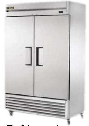
Refrigerador de alcance